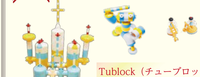
Tublock (チューブブロック)

配管継手メーカーの株式会社ベンカンが「私たちの生活に欠かせない水や電気や石油を運ぶ、配管の重要性をもっと知ってほしい」という思いで開発したブロック玩具。2016年8月に分社化し、株式会社チューブブロックを設立。配管を模したカタチで、どちらからも繋げることができる連結構造を持ち、繋げた後に回転もできるので、従来のブロックでは作るのが難しいなめらかな曲線や角度も作り出せます。自転車やクマ、キリンなどの動物が作れるセットも人気ですが、その他にも思いついたものを自在に組み立てることができます。どんどん繋げていくことで新たなひらめきも!