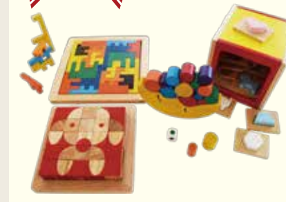
脳活キューブ(※左下)