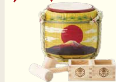
ミニ鏡開きセット